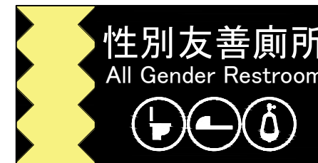
▲懸臂式廁所標示指示牌示意圖