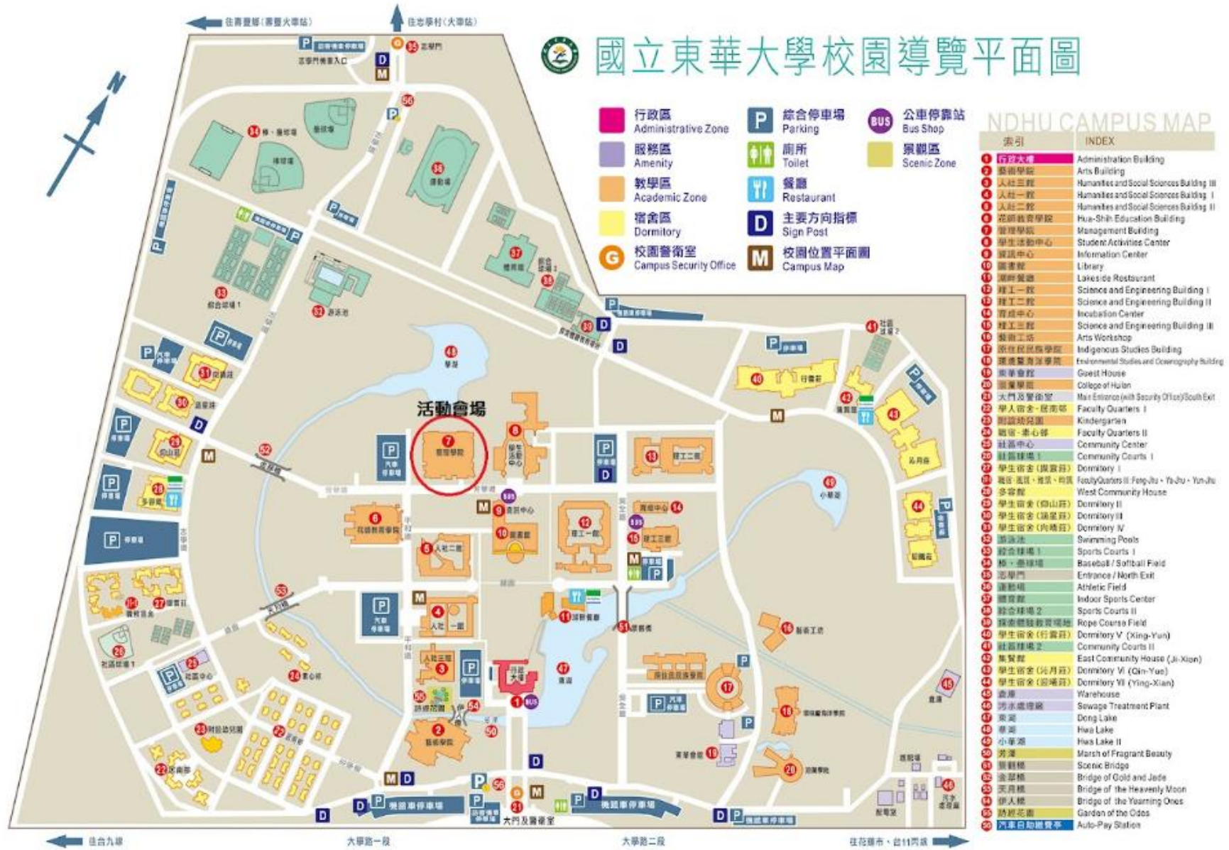
國立東華大學校園地圖